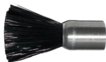
2049009 1/8BSP/F/P щетина 30 мм в длину, 57 мм в ширину общая длина 60 мм