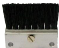
2037165 1/8BSP/F/P щетина 30 мм в длину, 57 мм в ширину общая высота 50 мм